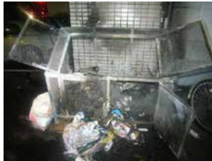
ごみステーション