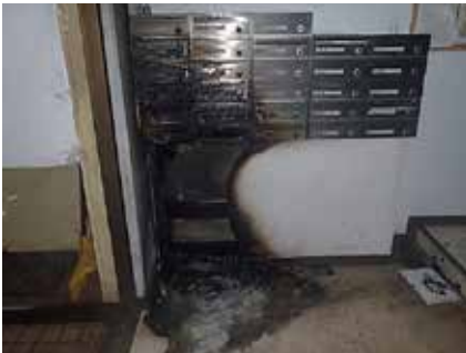
共同住宅などの共用部分