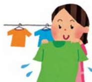
洗濯物はよく 脱水してから 干しましょう