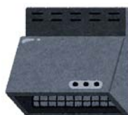
炊事の際は必ず 換気扇を回しましょう

冬の外気はよく乾燥しているの で、時々窓を開けることで、室内の 湿度を下げるすることができます。