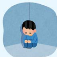
空気の流れが悪いと 湿気も溜まりやすい