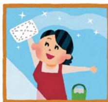
こまめに拭き取りましょう

たとえ結露が発生しても、こまめに拭き取っていただければ壁や床を汚したり、窓ガラスが凍りついたりすることはありません。