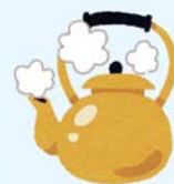
沸騰したやかん 約1,000cc/1時間