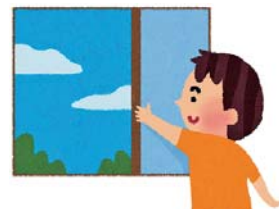
換気してから暖房しましょう

昼間不在がちだと、どうしても部屋の温度が下がります。室温が下がると、空気中に含むことができる水蒸気も当然少なくなります。