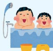
浴槽・洗い場 約1,000cc/1時間