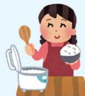
食事の支度 4~5人家族で約1,000cc